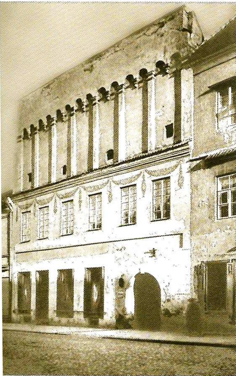
Pastato dalis prie gatvės senesnė, statyta XVI a., gotikos laikotarpiu. XVII a. pradžioje rekonstruota įgijo renesansinį atiką. XVIII a. rekonstruota rytinė dalis, pastatytas barokinis namas kieme.

M. Dluskiui 1821 m. pavasarį mirus, namą kapitula leido optuoti Žito-