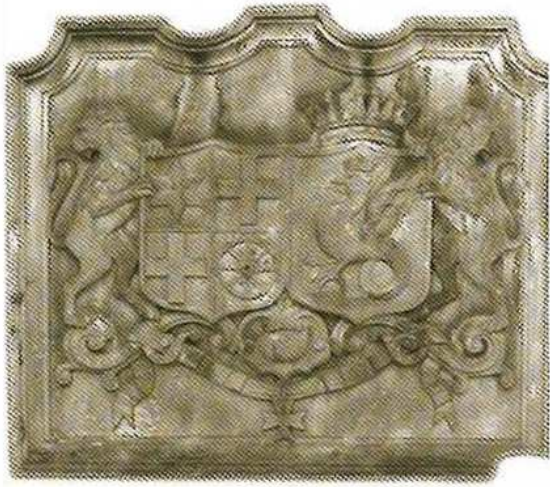
~ Akmeninė lenta-herbas ant tarpposės Pilies gatvės 4 pastato sienos, 1978 m.