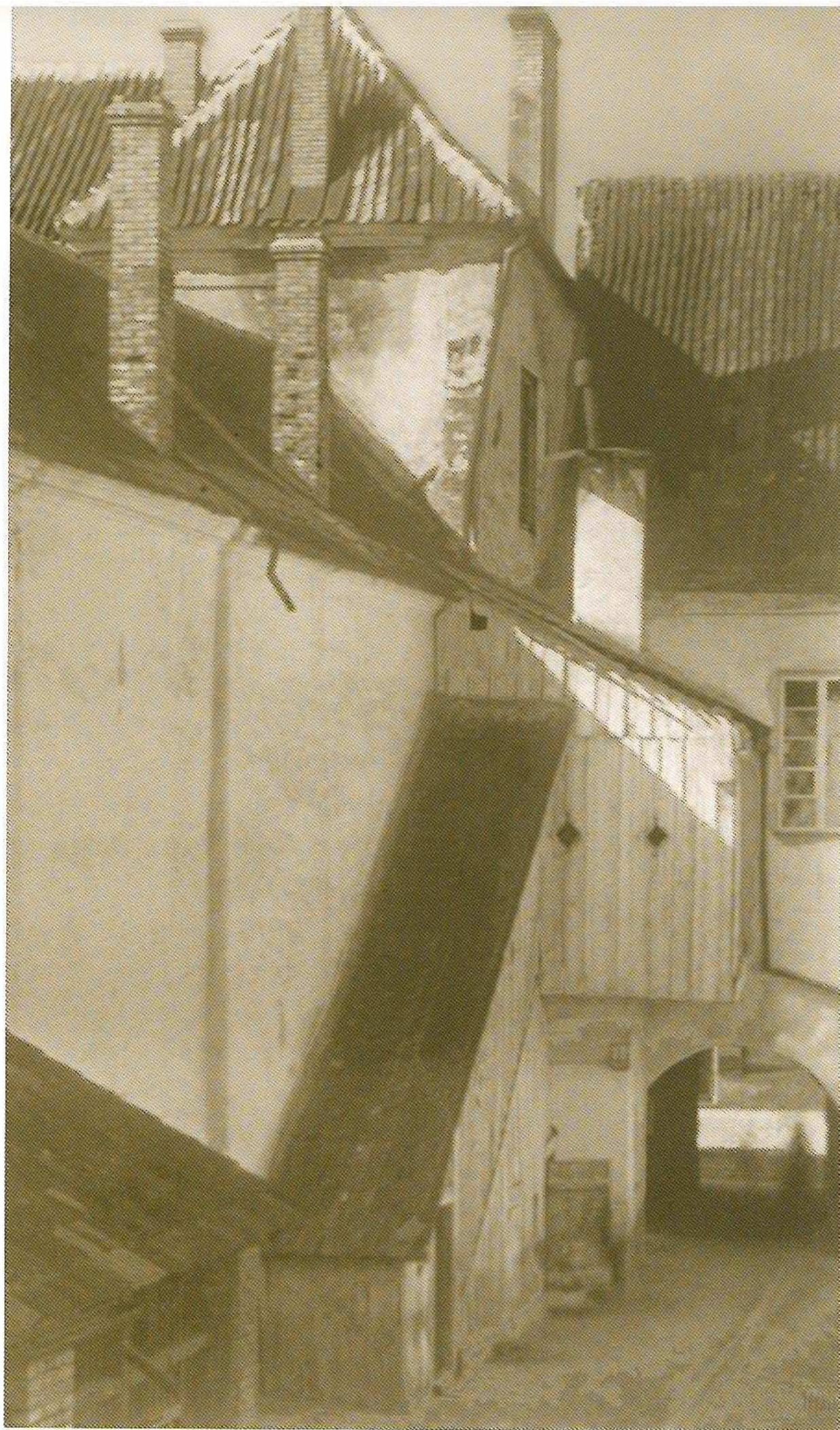
~ Kapitulos namo kiemas 1912 m.

Šiame pastate, atvykęs iš Lvovo 1920 m. gruodžio 1 d., trumpai apsigyveno karingasis lenkų vyskupas Vladislovas Bandurskis, po metų persikėlė į Vyskupų rūmus. Aršus lenkų nacionalistas, rusų priešas, V. Bandurskis vyskupu konsekruotas 1906 m., paskirtas Lvovo arkidiecezijos sufraganu, be to, ėjo Krokuvos dvasinės seminarijos rektoriaus pareigas, buvo aktyvus visuomenininkas ir politikas. 1912–1913 m. jo bute svarstyta pasikėsinimo galimybė. Siekiant sužlugdyti caro atvykimą į Varšuvą, per šventinimo ceremoniją planuota susprogdinti naują stačiatikių soborą Saksų aikštėje. Carui atšaukus savo vizitą į Varšuvą, sumanymo sprogdinti soborą atsisakyta. Pirmojo pasaulinio karo pabaigoje V. Bandurskis aktyviai rėmė Juzefą Pilsudskį ir lenkų legionus, lankėsi fronte. Į L. Želigovskio užimtą Vilnių atvykęs V. Bandurskis buvo Vidurio Lietuvos karinių pajėgų vyriausias kapelionas, jam paskirta generoliška pensija. (12, 563-564)