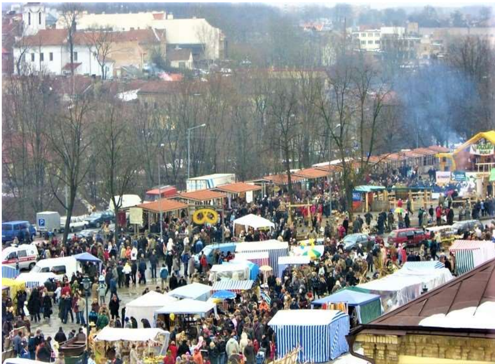
2007m. Kaziuko mugė Tymo kvartale