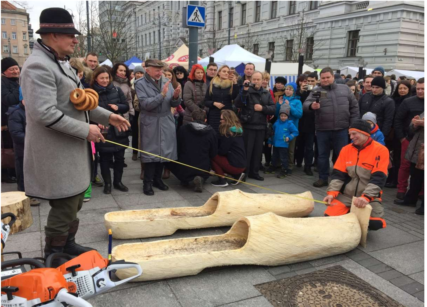
2017 m. Didžiausios klumpės rekordas