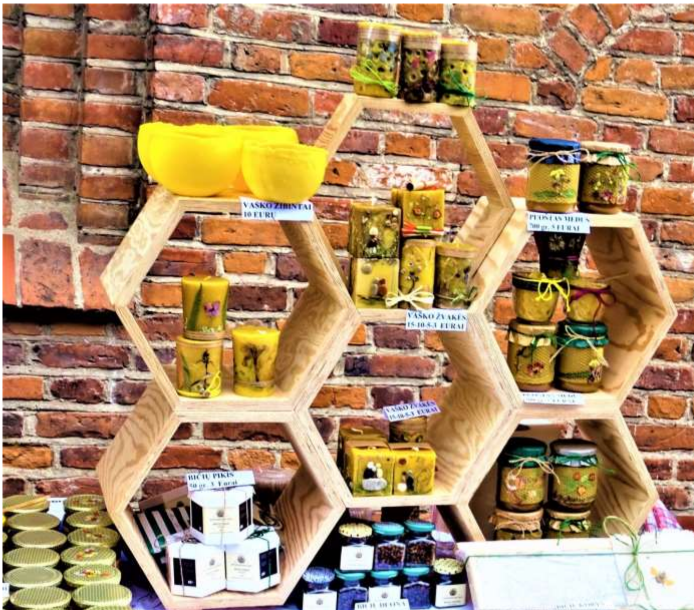
2016 m. Bitininkų gėrybės ir kūnui, ir sielai