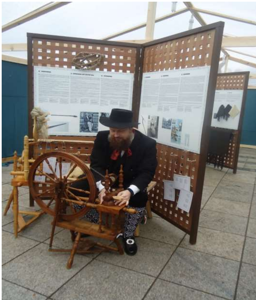
2017 m. Dalyvis iš Norvegijos