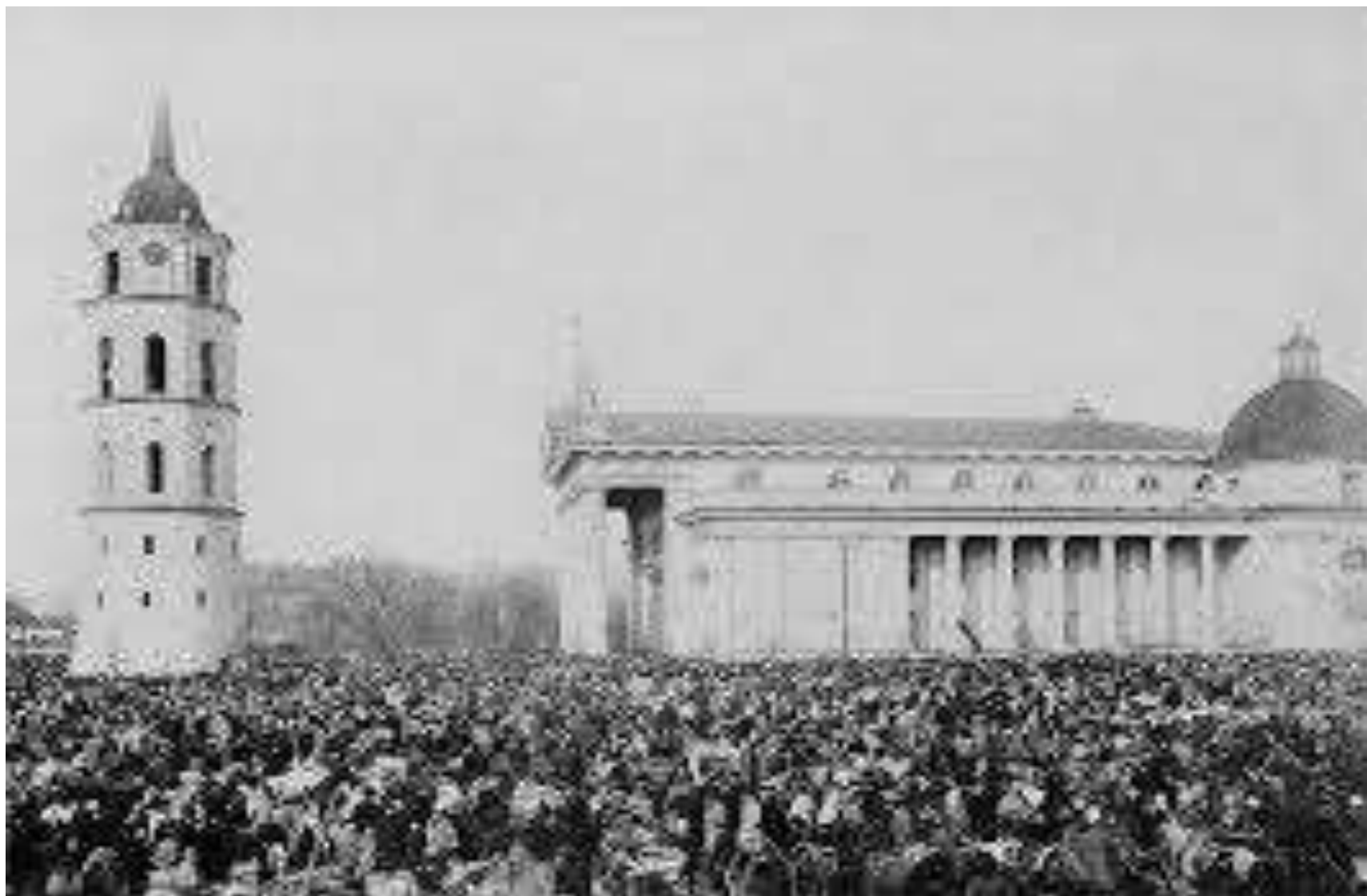
Apie 1900 - 1910 m. Banguojanti šventinė jūra.