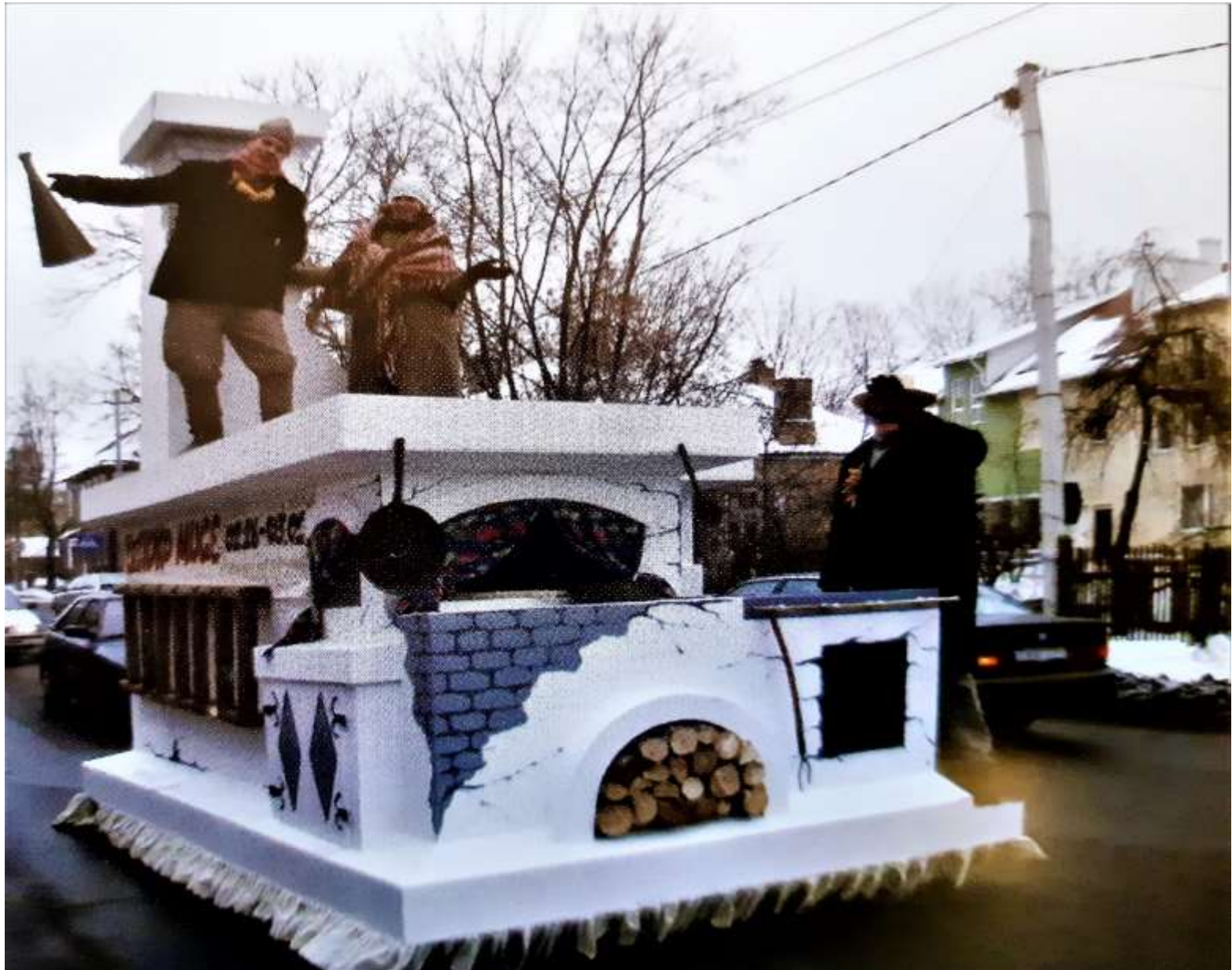
2005 m. Tinginio svajonė – važiuojanti krosnis