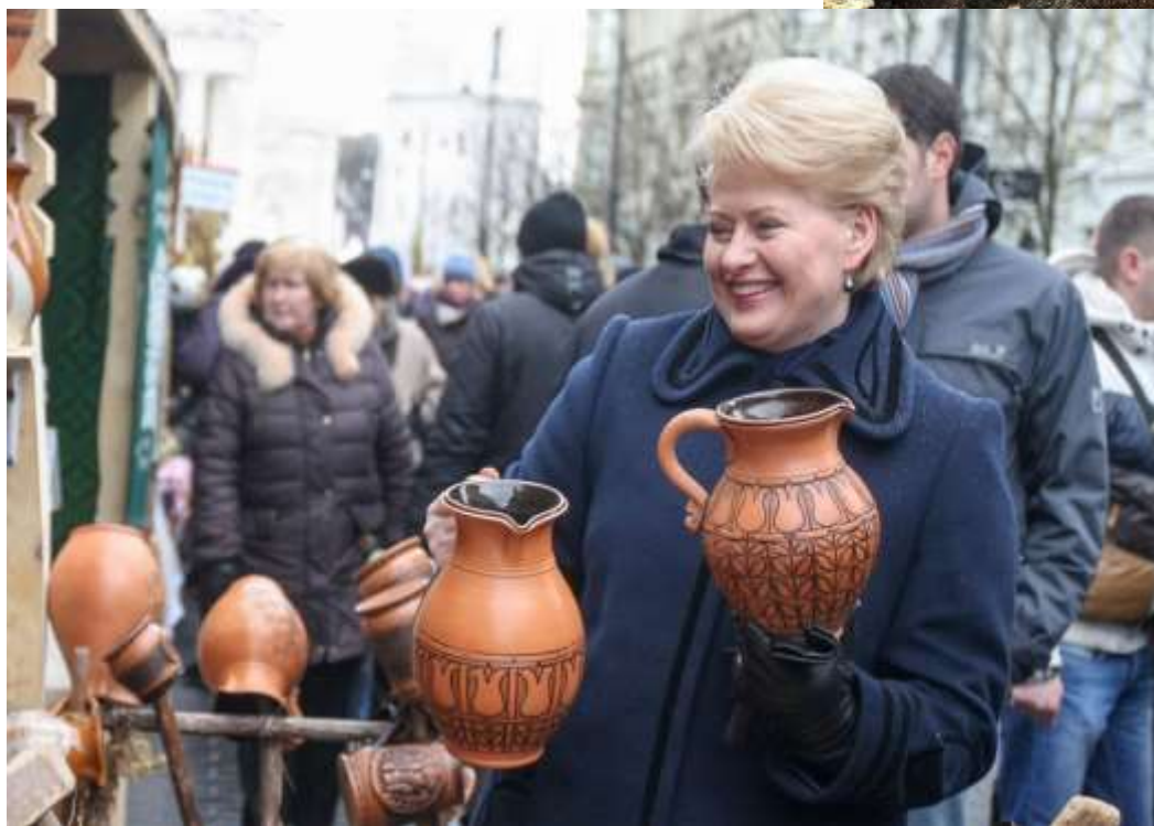
2007 m. esami ir būsimi prezidentai Valdas Adamkus su žmona ir Dalia Grybauskaitė