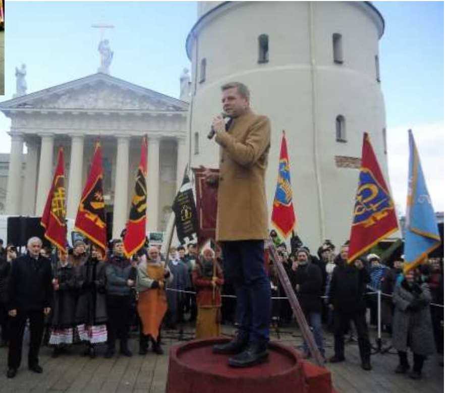
2014, 2017 m. sostinės meras Remigijus Šimašius