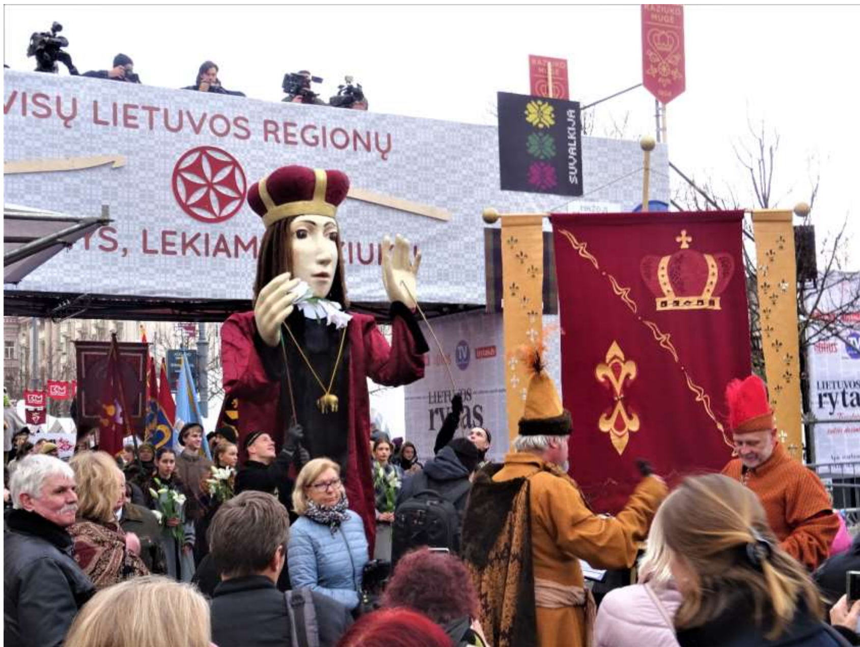
2019 m. 4 metrų aukščio tiltas per Gedimino pr. prie Vinco Kudirkos a.