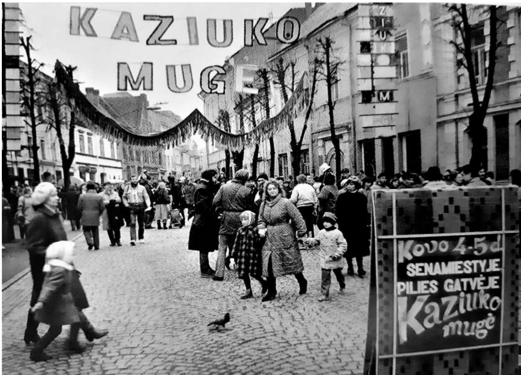
1989 m. Kaziukas sugrįžo į Pilies gatvę