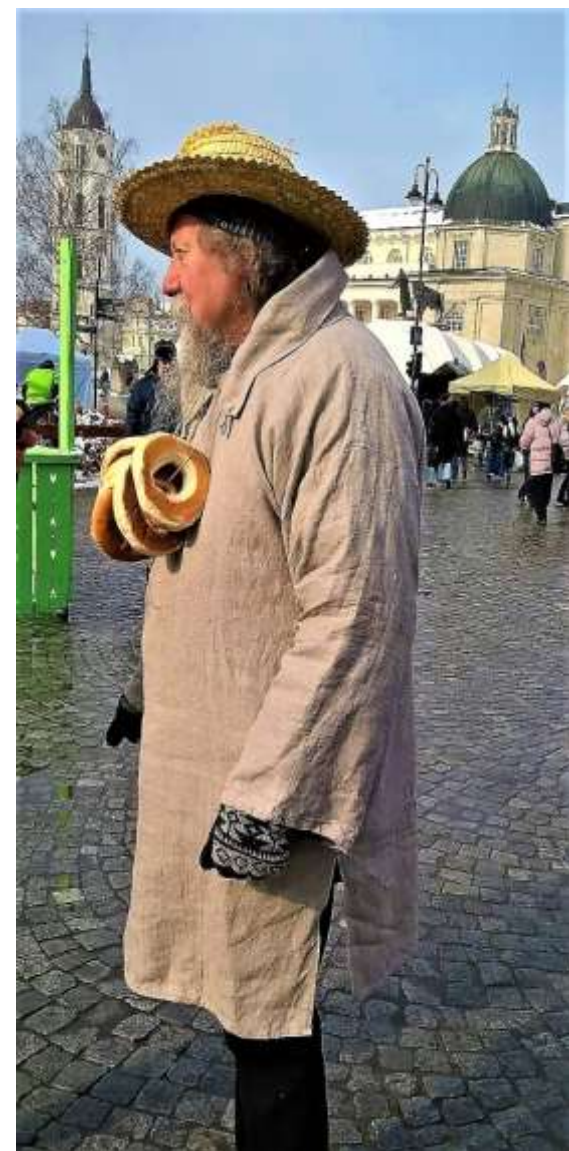
20015 m. mugės praeivių akis traukia riestainių krūvos.