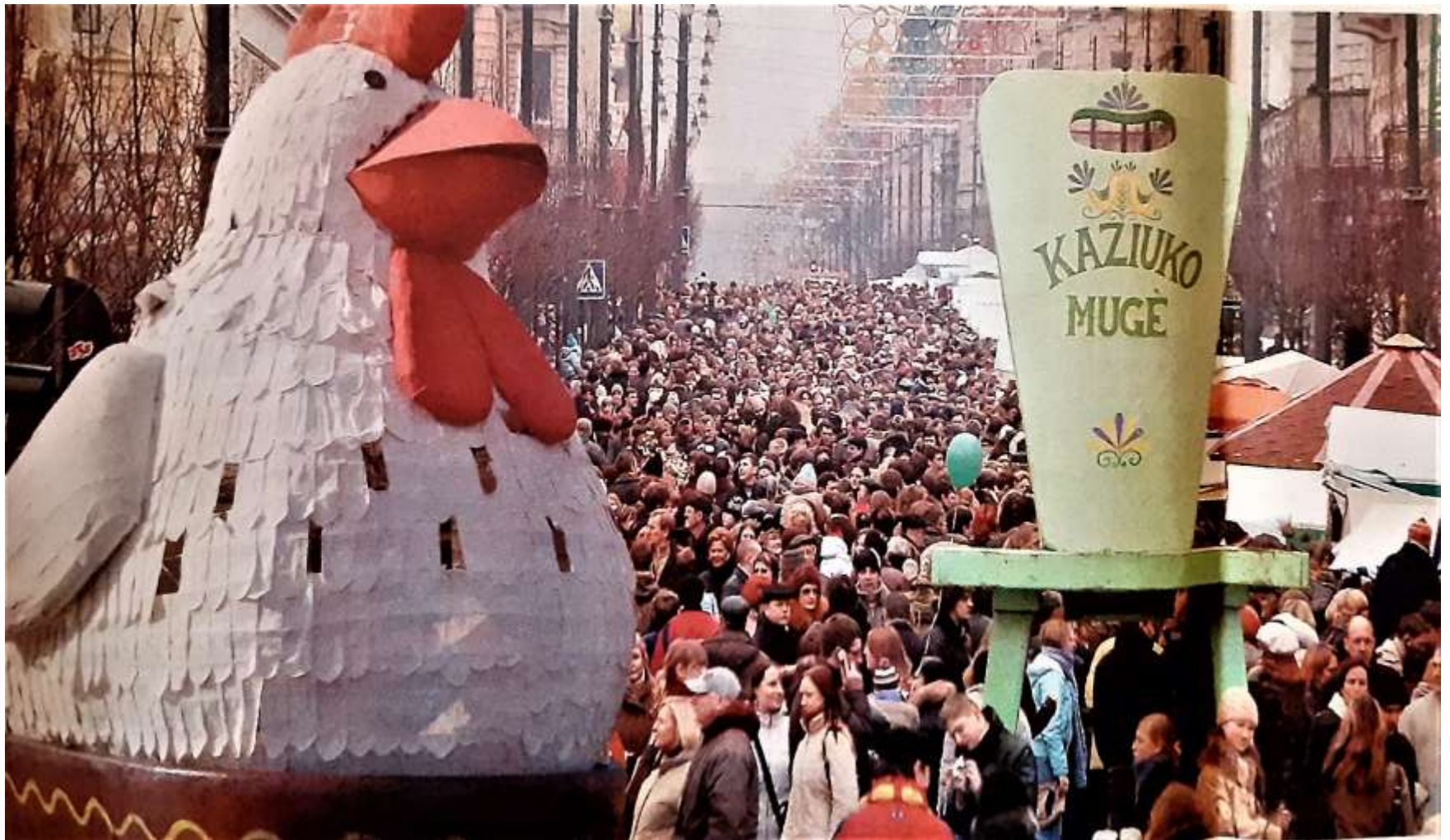
2007 m. Kaziuko mugė pabudina miestą